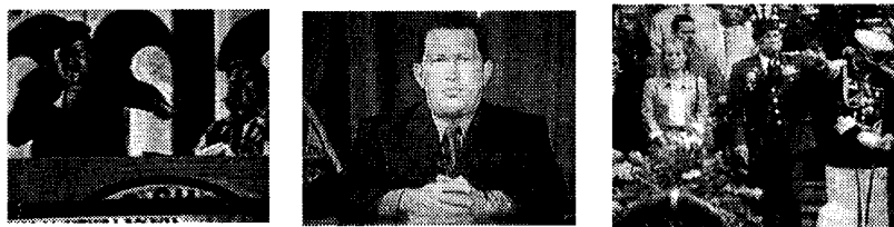
Figura 1 Código semiótico vestimenta

Con respecto a la cinésica -disciplina que permite el estudio de los gestos, movimientos y posturas- (Poyatos, 1994:186) el líder político presenta rigidez en sus gestos faciales y corporales, proyecta la postura erguida de un militar. Estos gestos que van desde un levantamiento de cejas, señalamientos hasta simular un golpe, cumplen una función enfatizadora de la palabra (Birdwhistell, 1994:75). Además, están relacionados con la construcción de las identidades y entidades, ya que cada vez que el emisor se dirige bien sea al pueblo o a sí mismo lo reitera con su gesto. La gestualidad también está manifestada en el uso de los llamados deícticos gestuales y simbólicos . Un ejemplo de estos deícticos simbólicos es cuando el líder dirigiéndose al pueblo le dice: “[...] y aquí tiene que acabarse la difamadera es [...]” el “ aquí ” es para referirse al país (Figura 2).