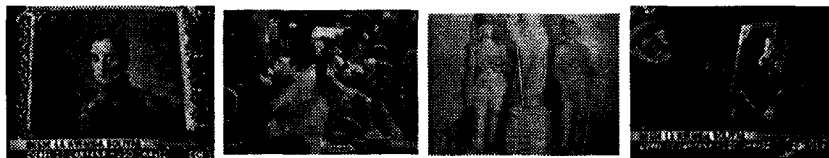
Figura 3 Códigos semióticos relacionados con el público

Todas estas dimensiones visuales le dan credibilidad a la intención de comunicación del emisor, ya que, casi todos los elementos lingüísticos planteados en ambos discursos están reflejados en la imagen (Figura 3).