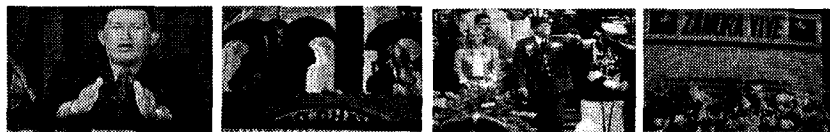
Figura 4 Códigos semióticos vinculados con el escenario

Todo lo contrario sucede cuando el sujeto hablante emite sus discurso en espacios abiertos o naturales. Éstos al igual que las vestimentas están adaptados a un contexto determinado y relacionado con el mensaje, como el caso del discurso sobre Zamora, el cual está transmitido desde el Panteón Nacional (Figura 4).