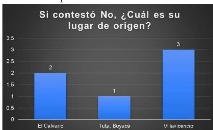
Figura 2. Lugar de origen de los encuestados que no proceden del mismo lugar que se producen sus productos.

Nota. Elaboración propia a partir de resultados obtenidos de la encuesta.