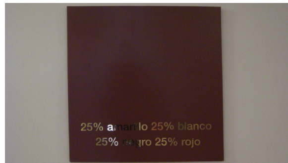
Figura 4. Última pieza dentro del recorrido de la muestra: 25% amarillo, 25% blanco, 25% negro, 25% rojo.