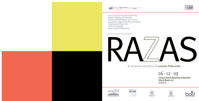
Figura 1. Invitación de la muestra. Centro de Arte de Maracaibo Lía de Bermúdez. Maracaibo, 12-2009 / 03-2010.

El proyecto se concibe como una gran instalación de 35 piezas completamente iguales de 100 x 100 cm cada una, todas en pintura acrílica industrial sobre una base de compuesto de madera, pero con una pequeña diferencia de matiz que además se reafirma en el texto en papel espejo que las acompaña. El texto recalca la evidencia de la constitución de esa diferencia al revelarnos la composición del color producido; al tiempo que nos refleja a nosotros mismos, para insinuar que simplemente somos nosotros, los mismos humanos, el reflejo o causa de esa diferencia (Fig. 2).