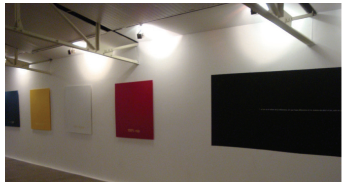
Figura 3. Vista del inicio de la muestra con los cuatro colores originarios.