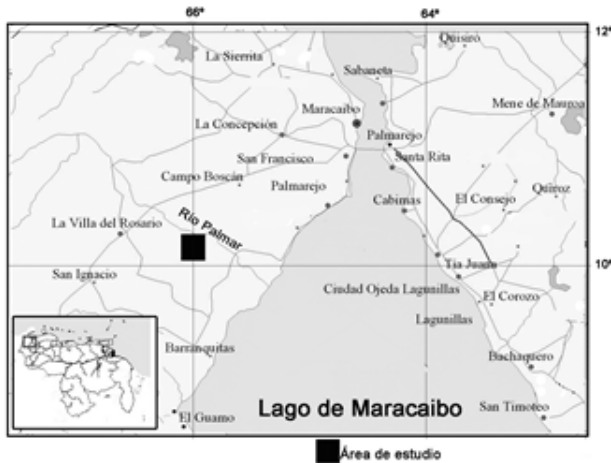
Figura 1. Ubicación relativa de la zona de estudio.