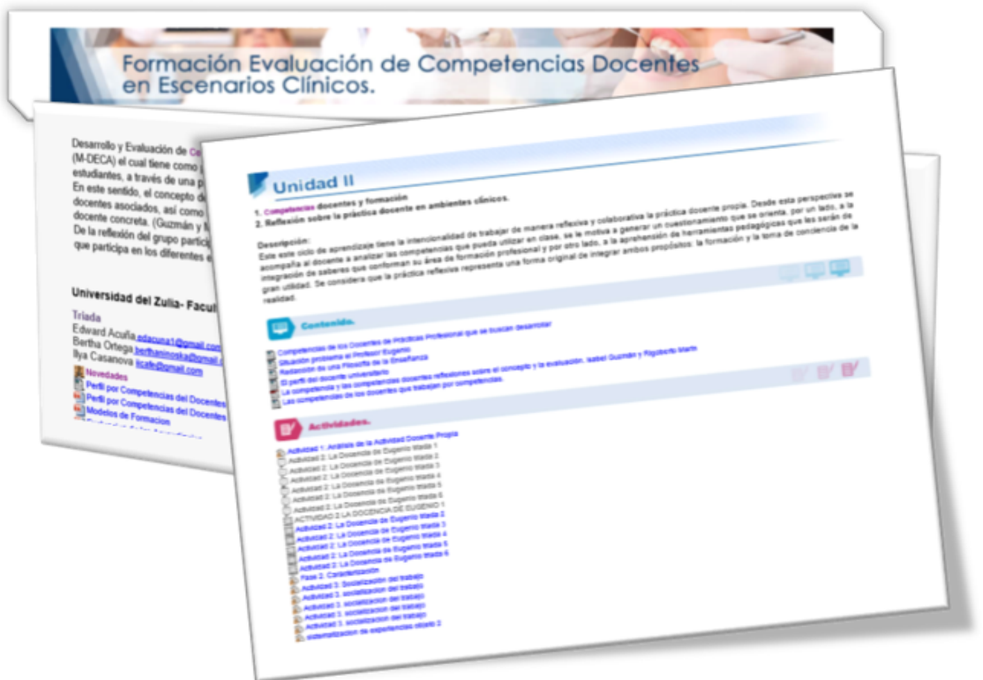
Figura2. Aula Virtual para la Formación-Evaluación de Competencias Docentes en la plataforma Moodle del Sistema de Educación a Distancia de la Universidad del Zulia.

mayor reto durante el proceso de la investigación el diseñar una planificación didáctica que armonizara las expectativas y motivaciones de los monitores clínicos con el desarrollo de competencias docentes bajo la visión del M-DECA y que además, permitiera la sistematización de experiencias educativas. En este punto y luego de reflexionar sobre las modalidades educativas y su viabilidad, el grupo participante en el proceso de sistematización de experiencias tomó la decisión de construir un aula virtual en la plataforma Moodle de SEDLUZ (Figura 2), utilizando como base el dispositivo de formación elaborado previamente y que permitió generar información importante para la toma de decisiones que posibilitan la mejora del des-