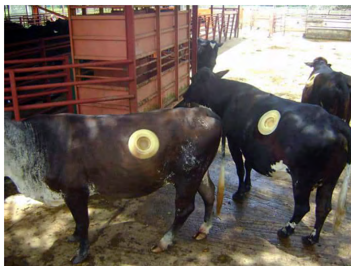
FIGURA 7. Vacas recuperadas de la cirugía, donde se observa que no hay escape de líquido ruminal entre la fistula y la cánula.

En los dos primeros animales, con ruminotomía dorso-ventral y tratados con penicilina+estreptomina, la cicatrización completa de la herida ocurrió a las 7 sem postcirugía (TABLA I). En los tres animales con ruminotomía dorso-ventral y tratados con oxitetraciclina, la cicatrización completa ocurrió 5 sem postcirugía, mientras en los dos animales con ruminotomía cráneo-caudal tratados con oxitetraciclina, a las 4 sem postcirugía, la retracción de los labios de la herida, completa cicatrización y la retracción, fijaban fuertemente la CP en la fistula. Muzzi y col. [17] y Holmbak-Petersen y col. [9] observaron recuperación completa de la herida a las 4 sem postcirugía, usando la técnica de FCR de un solo tiempo. De las siete vacas operadas, seis (86 %) no exhibieron escape de líquido ruminal entre la fistula y la cánula (FIG. 7), mientras una sola vaca (14 %), la alérgica a la penicilina, presentaba un ligero escape de líquido ruminal, el cual nunca aumentó. Este porcentaje de animales con escape de líquido