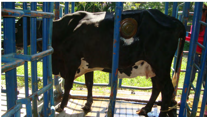
FIGURA 2. Brete para contención de tronco con la puerta lateral abierta

fuese capaz de mantenerse en una posición fisiológica normal que le permitiera respirar y eructar sin peligros de asfixia o de aspiración de fluidos ruminales. Los animales fueron sujetos en el brete y luego fueron colocadas sogas cruzadas a la altura del pecho, seguidamente dos lazadas fueron pasadas a través de las caras internas de los muslos para sujetar la cadera y evitar que el animal asumiera una posición de decúbito (FIG. 3).