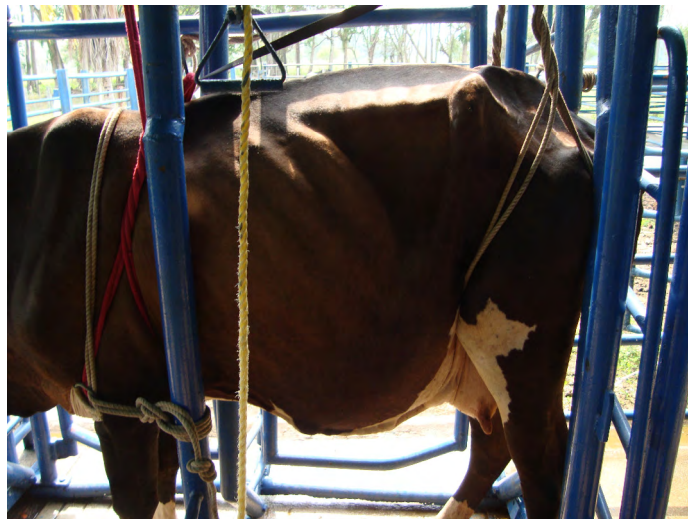
FIGURA 3. Vaca sujeta con sogas en el brete para contención de tronco