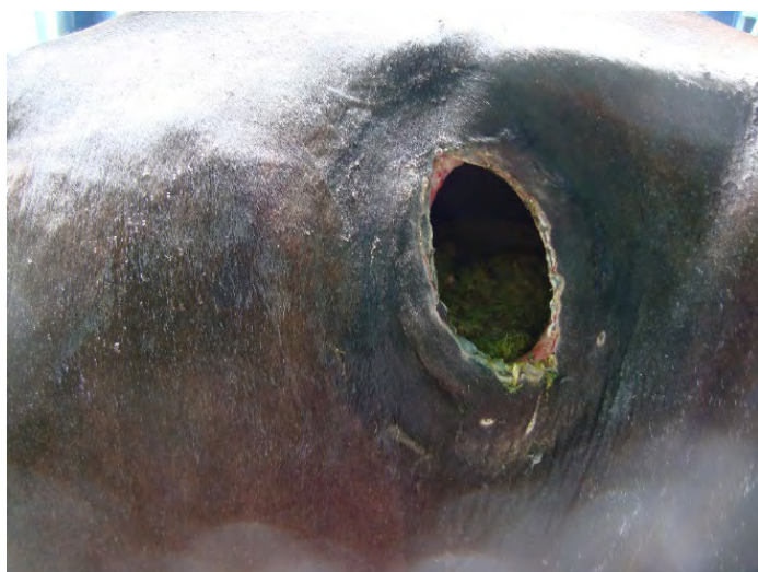
FIGURA 6. Fistula ruminal cicatrizada por segunda intención, donde se observa que la piel y el rumen se han unido firmemente

El líquido ruminal fue muy irritante para los tejidos, este hecho fue observado por ser más lenta la cicatrización en el borde inferior de la herida que se encontraba en contacto con dicho líquido de forma permanente. Esta irritación no se observó en la misma magnitud en el borde superior de la fistula, expuesto ocasionalmente a la acción de dicho fluido. Sin embargo, no se observó ninguna señal de infección bacteriana en la fistula de los animales. Aunque los bordes laterales inferiores de la herida dieron muestra de cierto grado de necrosis de la piel circundante durante las primeras dos semanas (sem), hubo su posterior reemplazo por tejido cicatricial (FIG. 6). Esto se atribuyó a la acción de la presión combinada de las suturas y el borde de la CP.