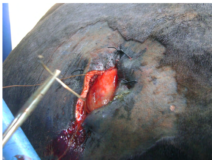
FIGURA 5. Patrón de sutura continua entre la piel y el rumen, para unirlos y permitir la ruminotomía sin riesgos de peritonitis