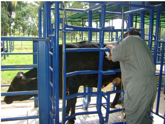
FIGURA 1. Brete para contención del tronco