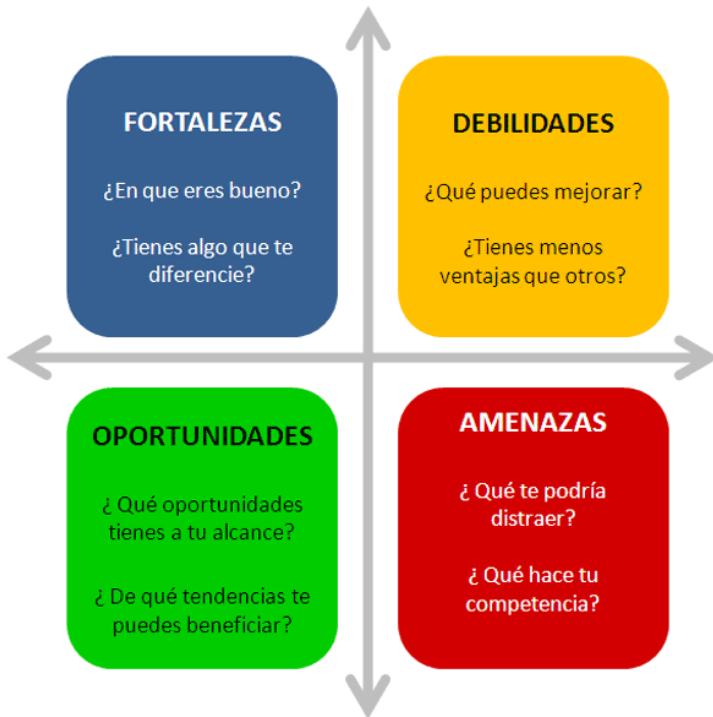
Figura No. 2: Metodología FODA.

En este orden de ideas, la pregunta que surge lógicamente es ¿cómo se pueden evaluar las políticas de marketing en turismo desde una perspectiva fenomenológica-hermenéutica? En principio para responder a esta pregunta conviene aclarar primero que, con una metodología híbrida así, se busca interpretar la forma como las personas involucradas en un proceso de elaboración de una campaña de marketing público en turismo para el desarrollo empresarial perciben (objetiva y subjetivamente) los aciertos, las amenazas, fortalezas, debilidades y oportunidades de su estrategia.