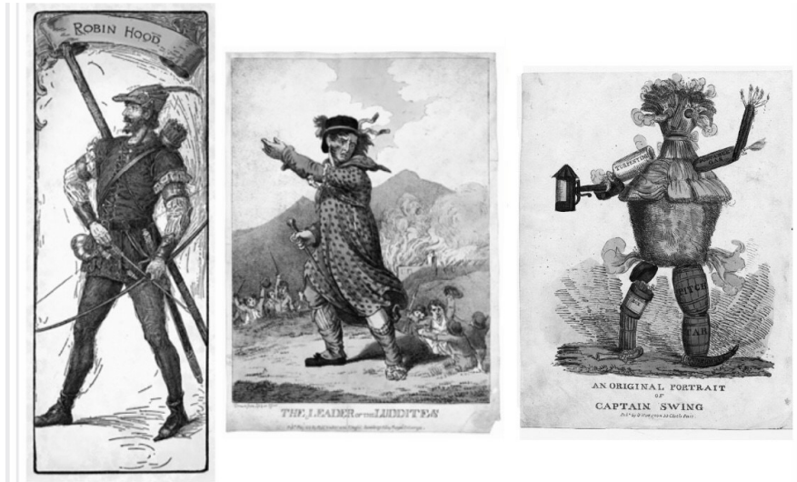
Gráfico No. 02. Robin Hood, general Ludd y capitán Swing.

Fuentes: National Geographic, Van Daal 2015, pp. 180 y 360.