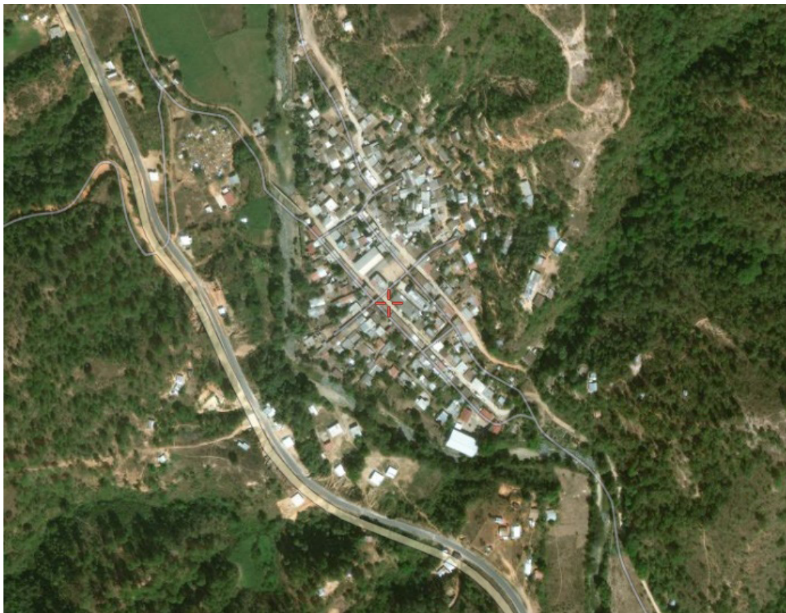
Figura 1. Foto satelital de la población de Rancho Viejo (2021) [1]

El MFD no tiene fines de lucro, es de carácter no-gubernamental y se encuentra al servicio directo de 1.425 habitantes (53,40% mujeres y 46,60% hombres), cuyo 27,65% es analfabeta, 99,23% indígena y 48,21% solo habla mixteco con desconocimiento del lenguaje español (Instituto Nacional de Estadística y Geografía [INEGI], 2020). Ante esta situación, el Módulo se suma a la intencionalidad de la CMM, en lo que respecta a la coordinación de las etnias distribuidas en la región, por intermedio de la formación continua en conceptos de equidad y técnicas sobre desarrollo sostenible y endógeno, de manera de impactar positivamente en las distintas áreas de la vida de los habitantes.