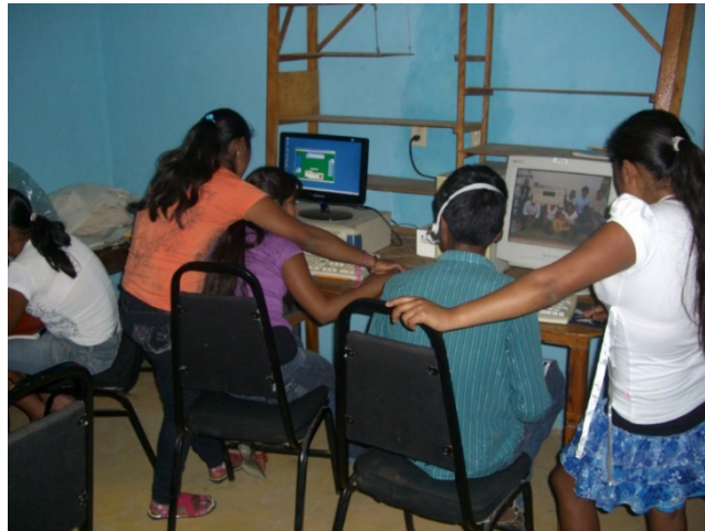
Figura 2. Clase de informática recibida por jóvenes nativos de Rancho Viejo (año 2011) 2