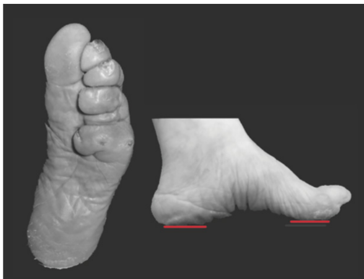
Imagen 4. Pie de loto

podrían señalar la ironía y la hipocresía de vivir en un mundo de apariencias, engaños y manipulación que finalmente se mostró como un lamentable estado de inutilidad «(p. 192). Esta cultura, gobernada por hombres, promovía cierta idea de belleza: la unión de alimentos era esencial para el embellecimiento del cuerpo femenino. El problema más común encontrado en las mujeres con pies de loto fue la infección a causa de las uñas encarnadas. Este problema podría empeorar considerablemente, produciendo la muerte por shock séptico. Según White (2014), el diez por ciento de las niñas con pies de loto murieron por gangrena y otras infecciones.