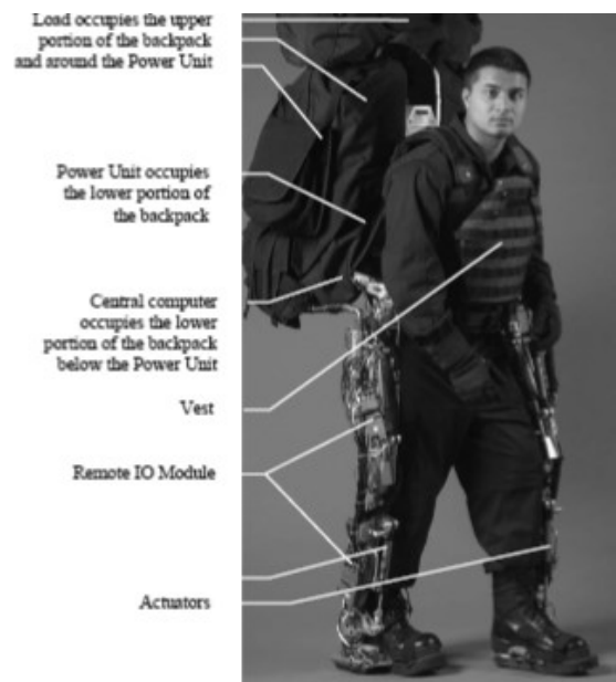
Figura 2: Berkeley Lower Extremity Exoskeleton (BLEEX)

Novedosa estructura de control, que se basa en la medición a través del propio exoesqueleto, sin tener que medir la fuerza dada por el operador humano. Plantea un sistema de control en base a una alta sensibilidad a fuerzas externas y torques y consta de dos lazos de realimentación, uno superior que representa como el piloto mueve el exoesqueleto a través de la fuerza aplicada y uno inferior que muestra como el controlador maneja el exoesqueleto.[17]