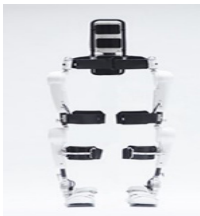
Figura 4: HAL □ para uso médico de CYBERDYNE.

HAL □ (marca registrada), para uso médico (Fig.4) consiste en un desarrollo lumbar inferior orientado para personas con desordenes en el sistema cerebral y nervio - muscular, el principio de funcionamiento es basado en la terapia de reaprendizaje del cerebro de las órdenes de caminar, sentarse, pararse, a través de un feedback entre el exoesqueleto y el usuario, es un algoritmo de intención de movimiento y está aprobado por la comunidad europea para su uso médico.