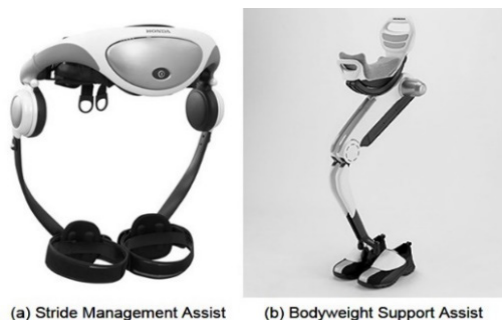
Figura 3: Exoesqueletos de fuerza y habilidad de la compañía HONDA

baja escaleras, está de pie, entre otros, con el fin de reducir la fatiga (cansancio), ambos dispositivos orientados para mejorar la calidad de vida del adulto mayor.