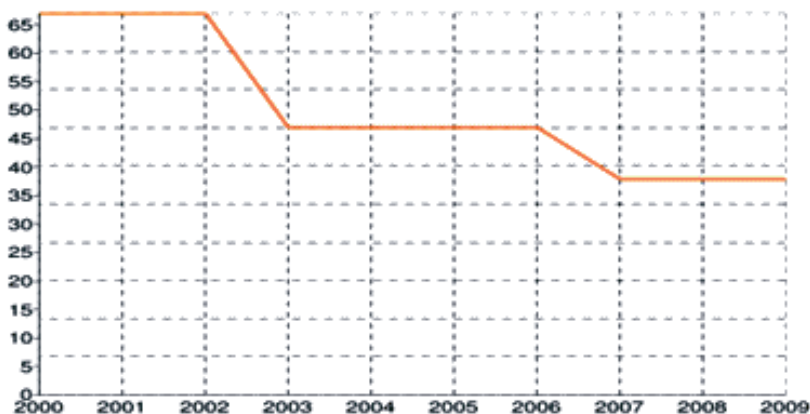
Grafico 1. Tendencia y comportamiento de la línea de pobreza 2000-2009

Por último, visualizamos en la Figura 1 el mapa mundial de la pobreza por país, mostrando porcentajes de población viviendo con $1 dólar diario. Basado en el Reporte de Desarrollo Humano de la ONU en 2007/2008. Hay datos faltantes en varias naciones.