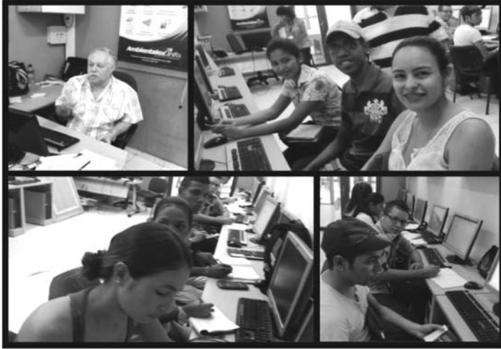
Imagen I. Registros fotográficos sobre capacitación en Edmodo y Excel