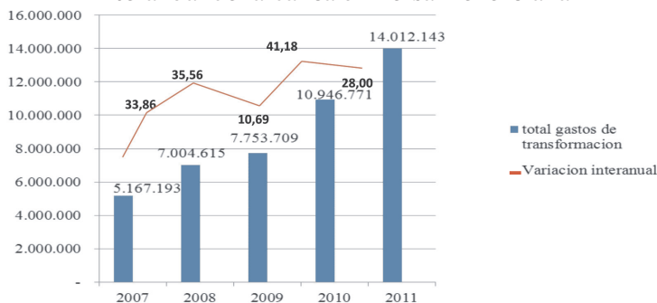
Gráfico 2. Comportamiento gastos de transformación y variación interanual de la banca universal venezolana