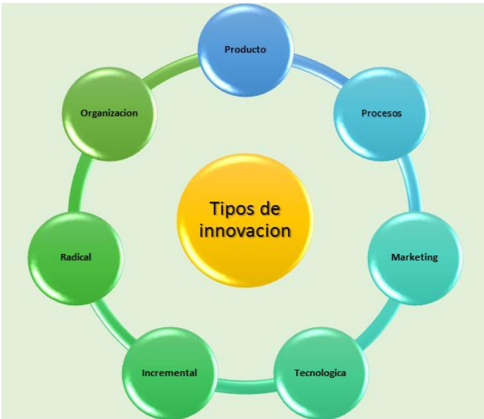
Figura 1 Tipos de innovación

A continuación se abordará la clasificación de la innovación desde el punto de vista del objeto. Hay que tener en cuenta que los tipos de innovación que se describen en este apartado son igualmente importantes dentro de la innovación empresarial, aunque tienen objetivos diferentes y requieren de enfoques y tareas diferentes. No obstante, todos requieren de la participación de gran parte del equipo de la organización, aunque en diferente medida, como lo demuestra la Figura 1: