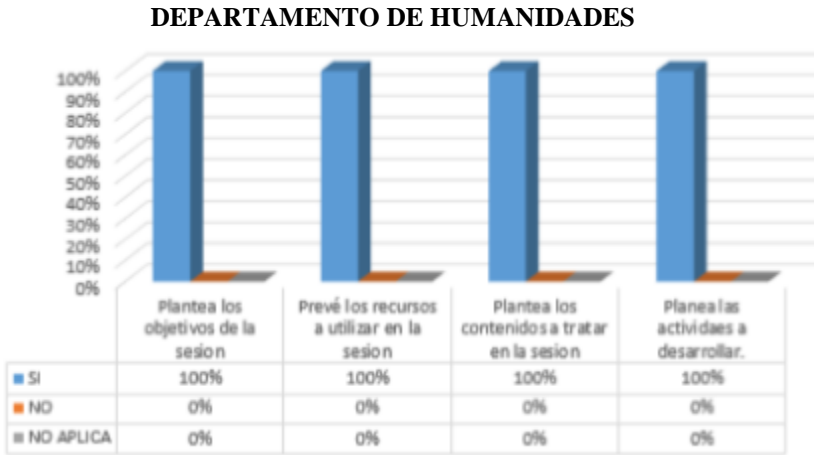
Gráfico 2: Categorización de Aspectos en docentes

Al confrontar los elementos conceptuales emitidos por los docentes de este Departamento en relación al Modelo Pedagógico Institucional MPI y los aspectos observados durante la clase se pudieron establecer elementos de fortalezas entorno a cada una de las categorías establecidas en el instrumento, denominado la ficha de observación, es así como la planeación se observó en cada una de las sesiones, donde se pudo poner en evidencia, los objetivos de la sesión, los recursos a utilizar en la sesión, se plantean los contenidos a tratar en la sesión y se proponen las actividades a desarrollar. La gráfica siguiente ilustra los alcances en el desempeño docente del Departamento: