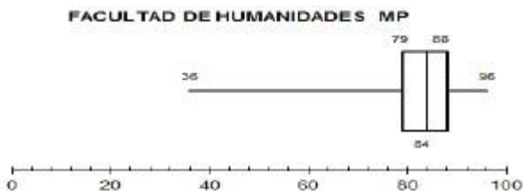
Gráfico 3. Resultados obtenidos coherencia entre la práctica docente.

También a través de siguiente gráfica de caja y bigotes, para el Departamento de Humanidades, se obtuvo que: