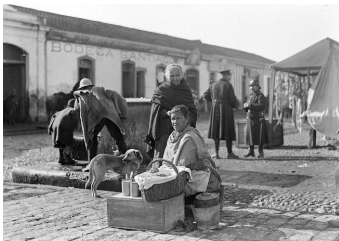
Figura 8. Mujer feriante sentada en un piso de mimbre con un canasto y su perro