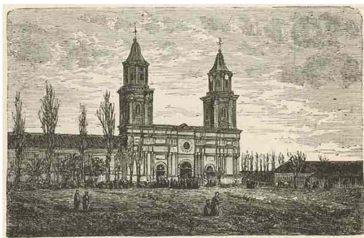
Figura 3. Iglesia de San Francisco

encontrar a “la gente culta de buen gusto las diferentes obras literatura, pianos, violines, flautas e instrumentos musicales” 27 .