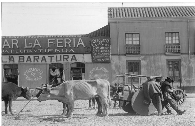
Figura 7. Tres hombres con sus animales de carga y carretas en la feria