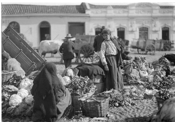
Figura 6. Vendedoras de repollo en la feria de Chillán (1910-1920).

En el movimiento comercial de Chillán debe mencionarse el conocido como nombre de Feria. Se celebran los Sábados de cada semana, una para artículos de consumo i útiles de casa, i otra en que se comercia el ganado. En ambas casos numerosos comerciantes celebran transacciones que suelen representar valores considerables 58 .