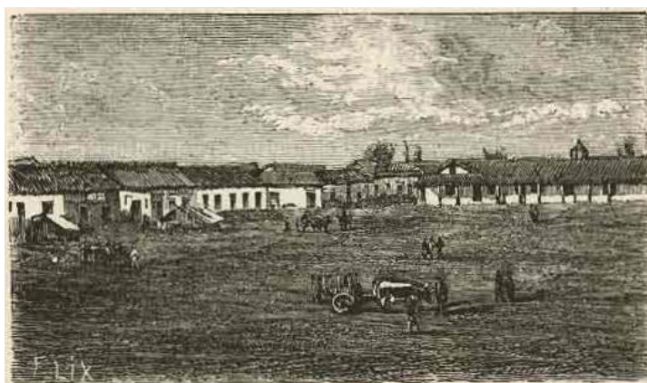
Figura 5. Plaza de la Merced o de la feria