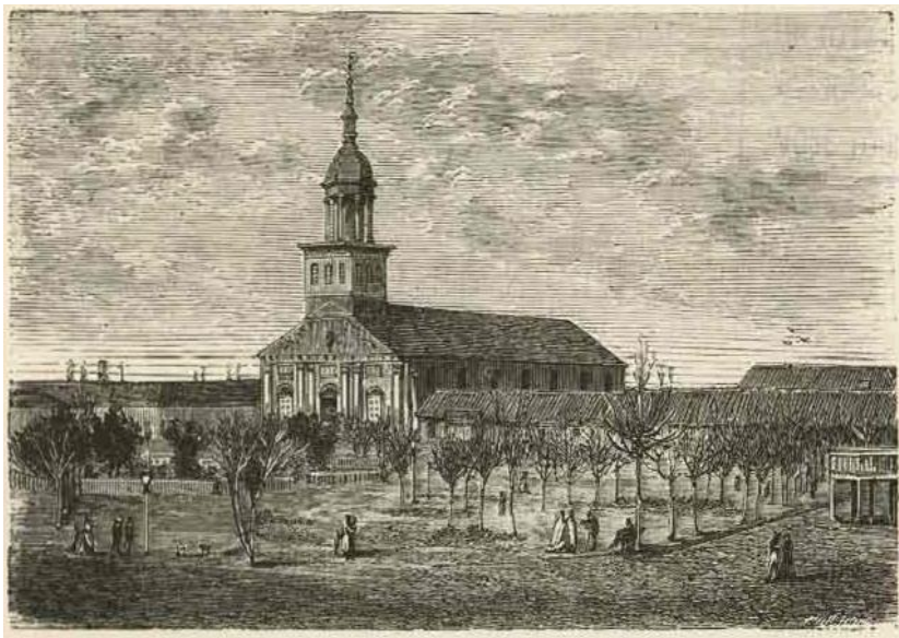
Figura 2. Plaza de la Independencia

parada militar, actividades religiosas y recreativas 15 , las cuales se realizaban con preferencias los días sábado y domingo por la tarde.