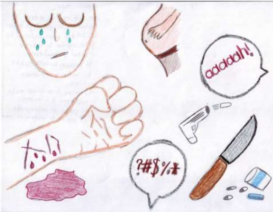
Dibujo 2. Violencia Interpersonal