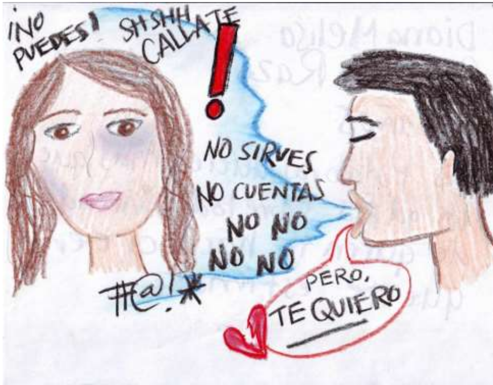
Dibujo 10. Violencia Intrafamiliar