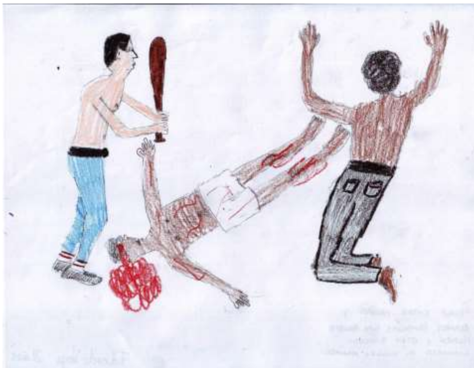
Dibujo 4. Violencia Económica