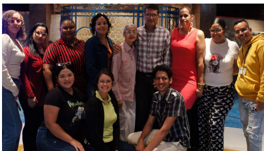
Asistentes a la actividad.

La película, que aborda temas como la fama, la vejez y la búsqueda de la juventud eterna, generó una amplia gama de interpretaciones e impresiones vinculadas a la polémica obra cinematográfica.