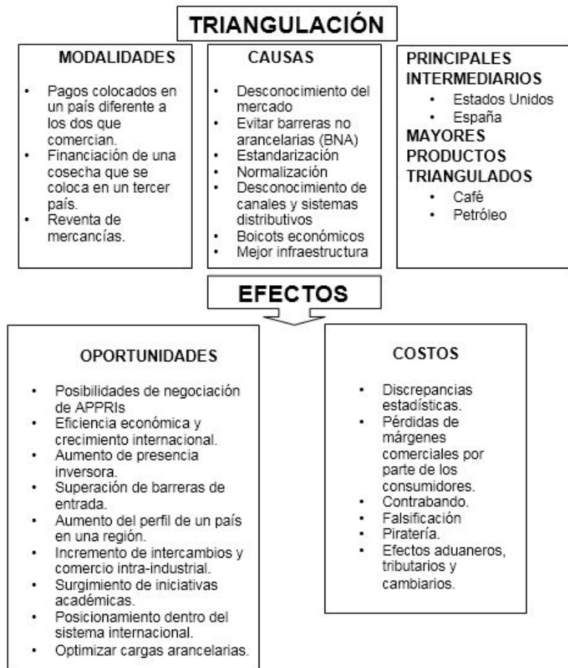
Diagrama 2 El fenómeno triangular

Fuente: elaboración propia con datos de Kitain (1982)