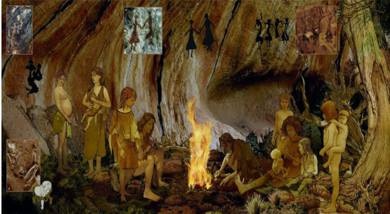
Ilustración 1 Exposición itinerante del Museo de Prehistoria de Valencia

Fuente: Mujeres en la Prehistoria (Museo de Prehistoria de Valencia 2019)