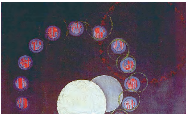
Figura 2. František Kupka. The First Step (1910-13). Óleo sobre lienzo. 83.2 x 129.6 cm. Ubicación: The Museum of Modern Art, NY, USA.

Esta experiencia astral serviría como inspiración para la elaboración de la pintura titulada The First Step (fig. 2) (1910-13), así como posteriormente para The Cosmic Spring I y The Cosmic Spring II . Vanessa Bruce (2007) llegó a comparar esta experiencia espiritual con la de un astronauta que ve por primera vez la Tierra desde arriba.