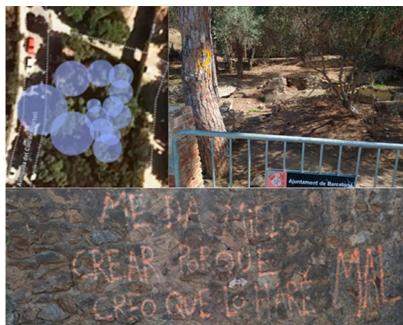
Figura 5 Materiales de "Límites".

La obra fue creada con un primer audio común en la entrada desde el cual se ramificaron tres rutas ascendentes. Una mayor interacción entre la ruta central y la derecha, también mayor en el nivel superior que en el inferior, pues es en el superior donde se encuentran las tres rutas; así, los fragmentos de audio buscaban más flexibilidad en sus posibilidades de combinación, ampliando así el espacio vivencial de modo significativo a través de la música. Su posición y elementos característicos se observan en la figura 5.