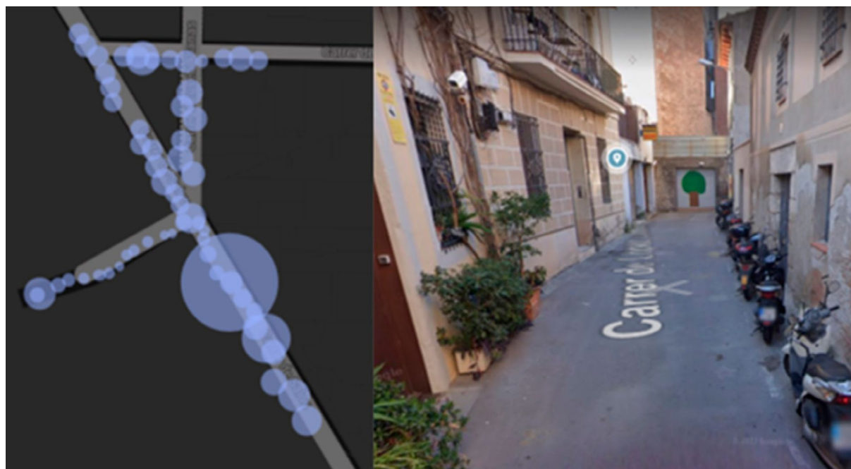
Figura 6 Materiales de "MA 2".