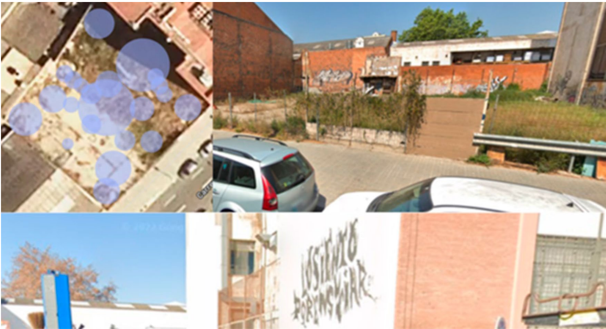
Figura 4 Materiales de “MA 1”.