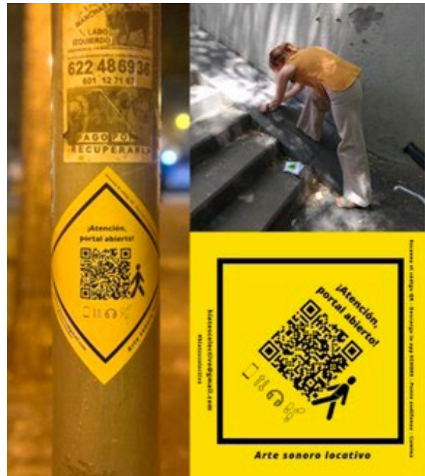
Figura 2 Instalación de los stickers.

Ahora siguen algunas consideraciones con respecto a las obras en concreto, desde su nacimiento, el proceso de elaboración, hasta cómo devinieron en conceptualizaciones propias de “formas sonoras espaciales”. Como parte del proceso de instalación espacial, pensando en la accesibilidad que permita el acercamiento colectivo, se decidió que en los espacios intervenidos sonoramente, es decir, donde se encuentran las obras sonoro-locativas, se realizaran instalaciones gráficas con stickers que indicaran la ubicación de la obra, proporcionando instrucciones en código QR para entrar en ellas (Fig. 2). 1